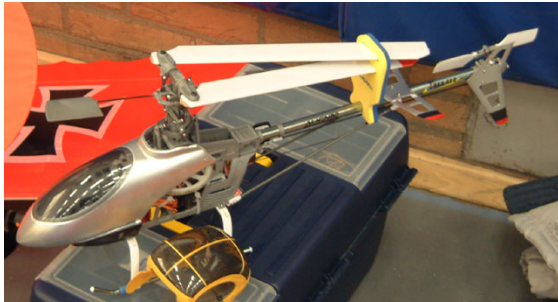
Hier zie je trouwens hoe een hoverend toestel er uit ziet van op de grond.